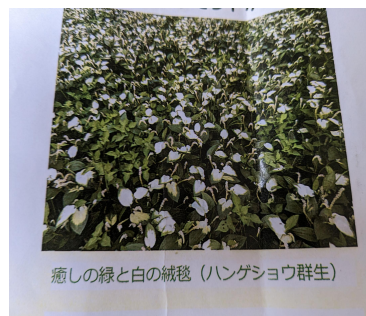
癒しの緑と白の絨毯 (ハンゲショウ群生)