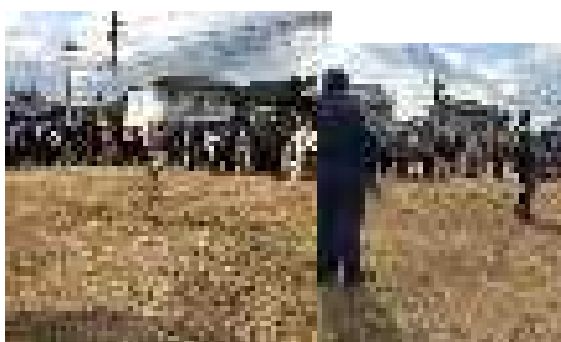
〈消火器による訓練〉