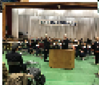
〈表彰される明治吟友会代表〉