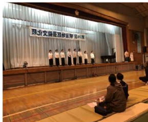
〈明治吟友会の皆さん〉