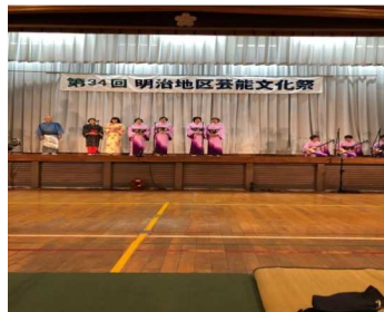
〈二目川・大分みどり会の皆さん〉