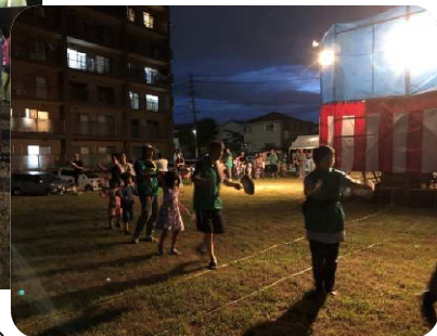
〈踊りに加わるこども達〉