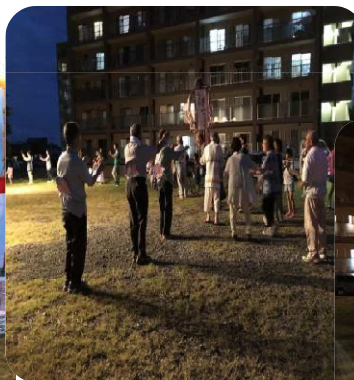
〈踊る区民の皆さん〉