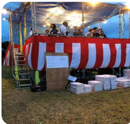
〈生のお囃子で盛り上げて頂いたみどり会さん〉

さらには、協賛いただきました、明野南小池原プレスセンターさん、みどり会さん、よつばファミリークリニックさんには、うちわや抽選会の賞品を提供していただき、また、白水長久苑さんには、ご仏前を頂き厚くお礼申し上げます。