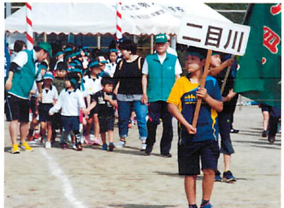
〈入場行進する二目川の選手〉

体育委員さん、班長さん、子ども会・育成会の皆さん、川友会さん、競技に参加して下さった選手の皆さん、お疲れ様でした。ありがとうございました。来年度も参加していただけるよう祈念いたしております。